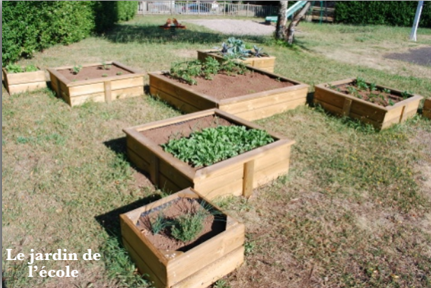
Le jardin de l'école