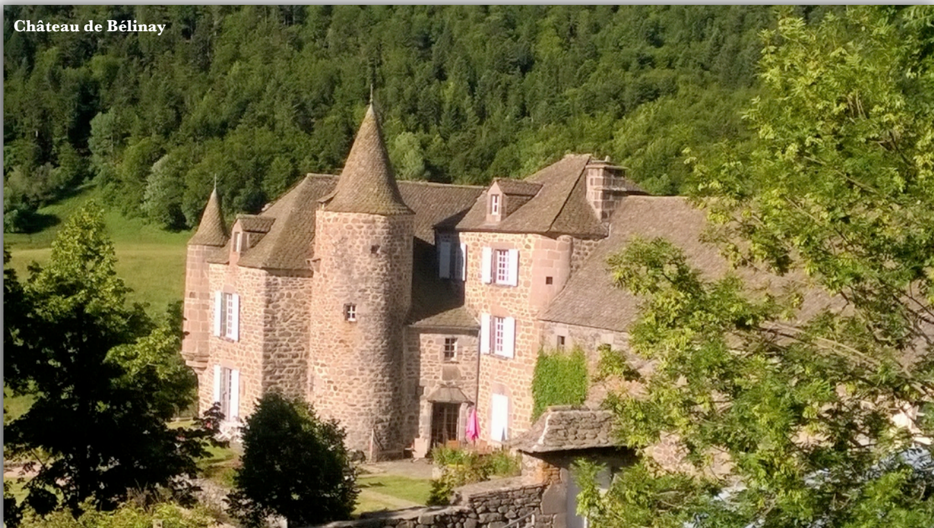
Château de Bélinay