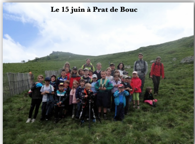
Le 15 juin à Prat de Bouc

Ils ont pu observer la faune et la flore locale. Les jeux des marmottes les ont réjouis. Les vaches et leurs veaux en estive ont eu aussi beaucoup de succès. Cette sortie était la dernière étape d'un travail mené sur la biodiversité avec une intervenante du parc des Volcans. En amont les élèves avaient effectué une sortie autour du village puis une autre au bois de Mercou.