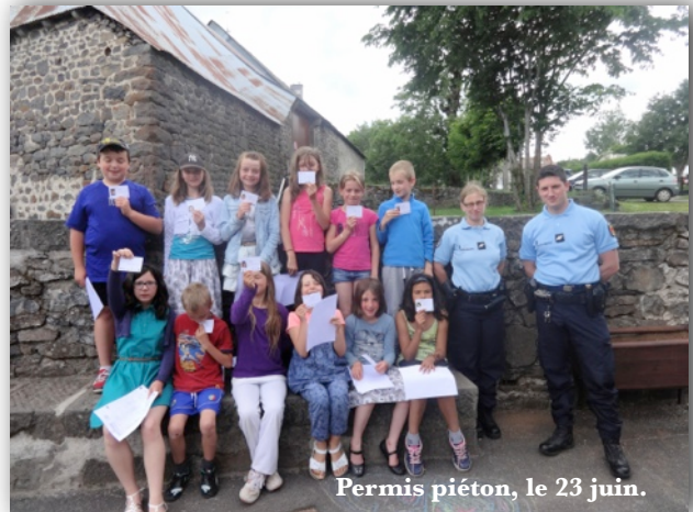
Permis piéton, le 23 juin.

informatique avec les élèves de Tanavelle, Oradour et Saint-Martin.