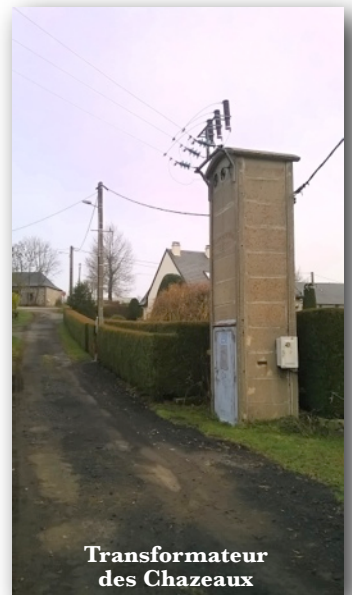
Transformateur des Chazeaux

La commune a fait procéder au remplacement de quatre candélabres à l'entrée du bourg en remplacement d'anciens tubes (entre la maison Vernine et le poids public). L'ancien transformateur des Chazeaux n'est plus en service. Il a été remplacé par un transformateur nouvelle génération situé sur le parking à l'angle du cimetière.