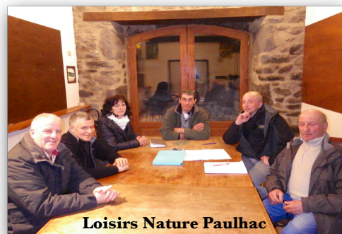
Loisirs Nature Paulhac

Plusieurs passionnés de loisirs nature, de la raquette à neige au VTT, du ski de fond à la randonnée se sont retrouvés et ont créé l'association Loisirs Nature Paulhac . Ils ont décidé d'unir leurs volontés afin de développer ces activités de pleine nature en direction du plus grand nombre. Les idées ne manquent pas pour promouvoir les activités aux quatre saisons. Le Foyer de ski de fond a ainsi rouvert à la salle polyvalente. Une page Facebook a aussi vu le jour pour informer au quotidien des événements à venir. La porte est ouverte à toutes les bonnes volontés tant pour porter des idées que pour donner la main. Géocoaching, sortie nature « faune et flore », trail pédestre, découverte du patrimoine local, etc. L'association a déjà organisé une journée « nettoyage des chemins » le samedi 09 mai. Les bénévoles ont rouvert des chemins dans le secteur de Sauvages, Prathuron, Le Jarry et Nozières. La journée, après le repas de midi, s'est terminée par un repas commun à la salle polyvalente pour tous les participants bénévoles.