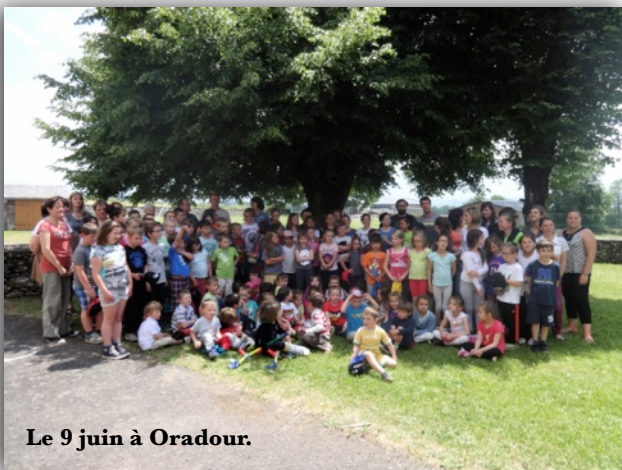
Le 9 juin à Oradour.

Dans le cadre du projet environnemental de l'école, les parents d'élèves se sont mobilisés pour réaliser des jardinières géantes qui ont été transportées près du terrain de jeux derrière l'école. Les enfants ont ensuite procédé aux plantations afin de récolter des fruits et des légumes de printemps. Certains pourront aussi s'en occuper pendant l'été mais les habitants du village qui le souhaitent pourront donner un coup de main pour l'arrosage.