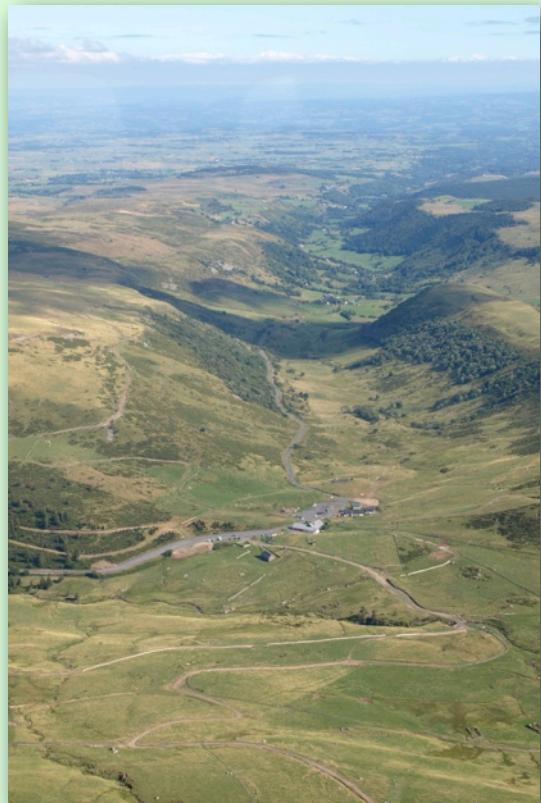
Prat de bouc, vu du ciel