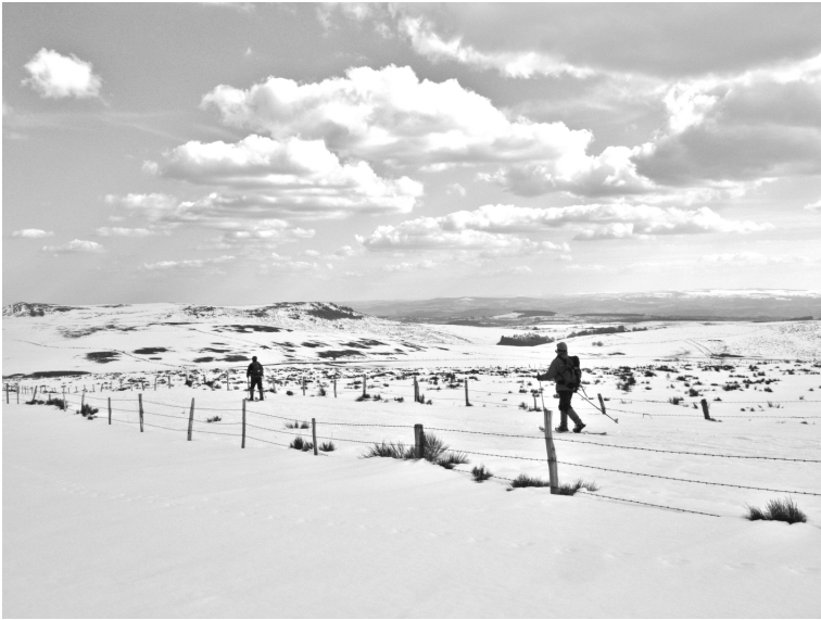
Vers le col de la Griffoul

à peine débauché d'une journée de travail, je rejoins le pied des sommets en quelques minutes – c'est le grand avantage de la moyenne montagne, contrairement aux Alpes ou aux Pyrénées, il faut peu de temps, moins d'une heure dans mon cas, pour atteindre les crêtes.