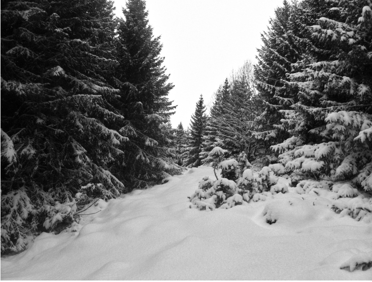
En forêt du Ché

les vivants un temps de « dormance », de retour sur soi et de compréhension. On connaît depuis longtemps les vertus de protection du manteau neigeux sur les écosystèmes, et les paysans ne craignent pas la neige pour leurs prés, bien au contraire. Ce qu'ils redoutent, c'est le sol livré sans défense à la morsure du froid. Les animaux qui ne migrent pas recourent à des stratégies variées. Ils hibernent, hivernent, changent d'habitat, leur métabolisme se modifie, leur plumage gonfle et leur fourrure s'épaissit, leur régime alimentaire change, se fait plus frustre, les oiseaux se regroupent et nichent en assemblée, les galeries souterraines forment de petites cités dont la population s'accroît, on s'économise, on meurt parfois, on attend les jours meilleurs. Les bipèdes doués de parole s'adaptent eux aussi : on change les pneus des autos, on fait des réserves de bois, on inventorie les gants, les écharpes et les bonnets car il ne faudrait pas que les enfants prennent froid dans la cour de récréation, les cantonniers contrôlent l'état des engins de déneigement, les clôtures pare-neige sont disposées aux endroits stratégiques, là où le vent produira des congères, les travailleurs saisonniers s'affairent avant l'ouverture des stations de ski, défrichent