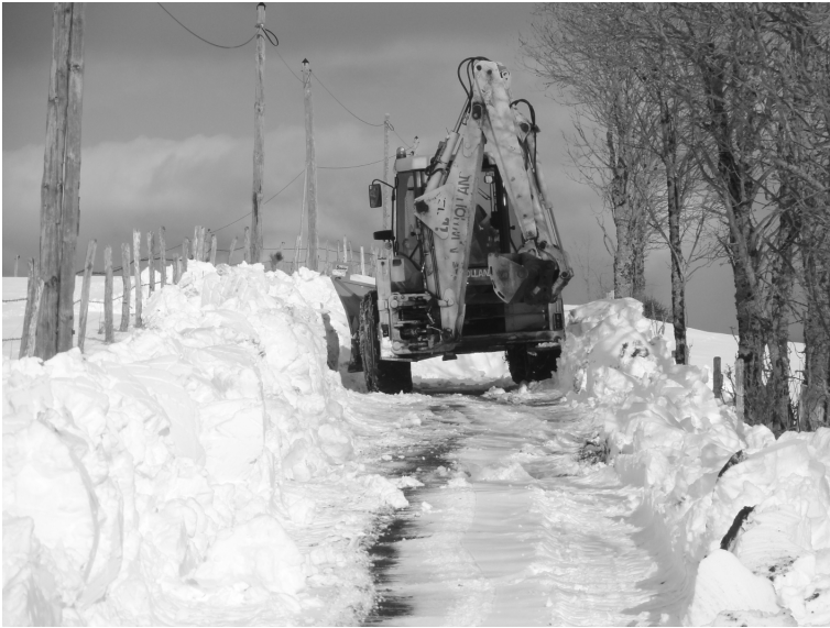
Déneigement sous le Puy de Mercou à Paulhac

le second. Le vent, d'où qu'il souffle, demeure encore aujourd'hui le principal motif de crainte des habitants de la Planèze, et si l'on expose désormais les maisons plein sud, captant autant d'énergie solaire qu'il est possible pour économiser sur sa facture de chauffage, les congères sur les routes sont toujours susceptibles de bloquer un village entier pendant quelques heures, voire une ou deux journées. Qu'il dure six mois ou quelques semaines, l'épisode hivernal marque non seulement les esprits mais aussi les corps – j'y reviendrai. Mieux encore, il est pour ainsi dire constitutif de l'identité du pays, et des gens qui y vivent. À quoi rime de vivre ici, autour des montagnes, et bien souvent à plus de 1000 mètres d'altitude, si l'hiver fait défaut ?