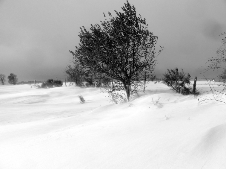
Congères sur le chemin de Galuze à Brageac

après avoir quitté le village, et, après un virage à gauche, vous y êtes. En vérité, il a erré une bonne partie de la nuit, et s'est vu mourir jusqu'à ce que les lueurs vacillantes d'une maison, la sienne, brille dans la nuit. »