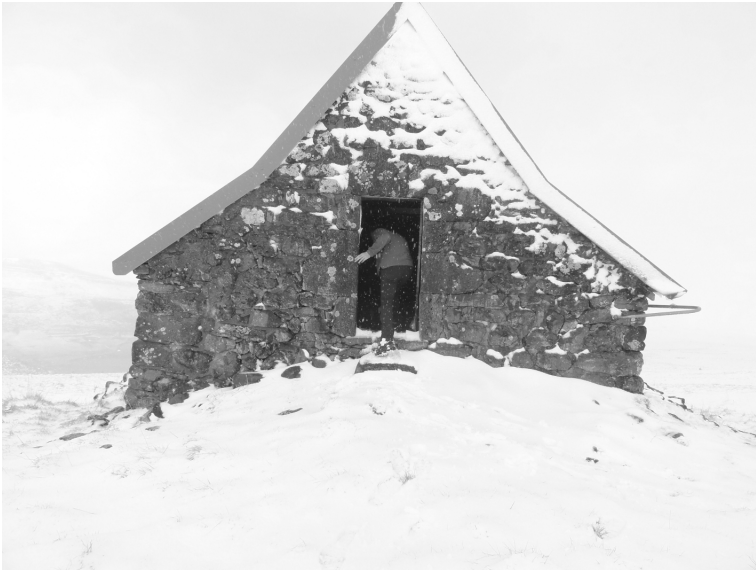
Le buron de la Mouche

et il fallait dégeler les encriers avant le début des cours. »