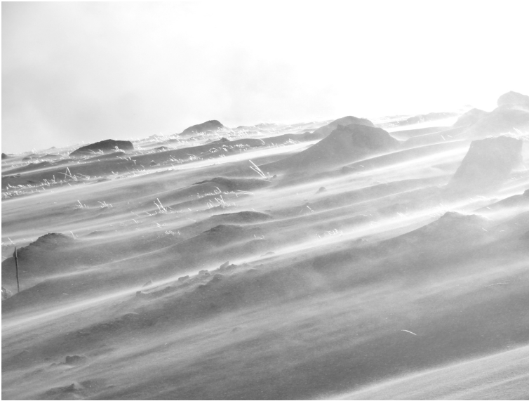
Tempête de neige au Puy de la Belle Viste