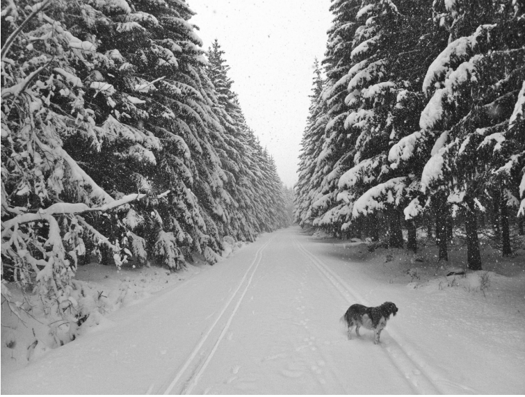
En forêt du Ché

plus souvent sur des skis qu'à pied au demeurant – il faut dire que j'ai des décennies de neige à rattraper, et vu mon âge et le réchauffement du climat, il s'agit de ne plus en perdre une miette ou un flocon ! Mon amie dit que je devrais aller habiter au Groenland ou au Spitzberg – il a commencé à neiger là-bas à la fin août ! Et pourquoi pas ? Mais pas maintenant, même si l'enneigement n'est plus ce qu'il était, je ne suis pas encore lassé des hivers cantaliens.