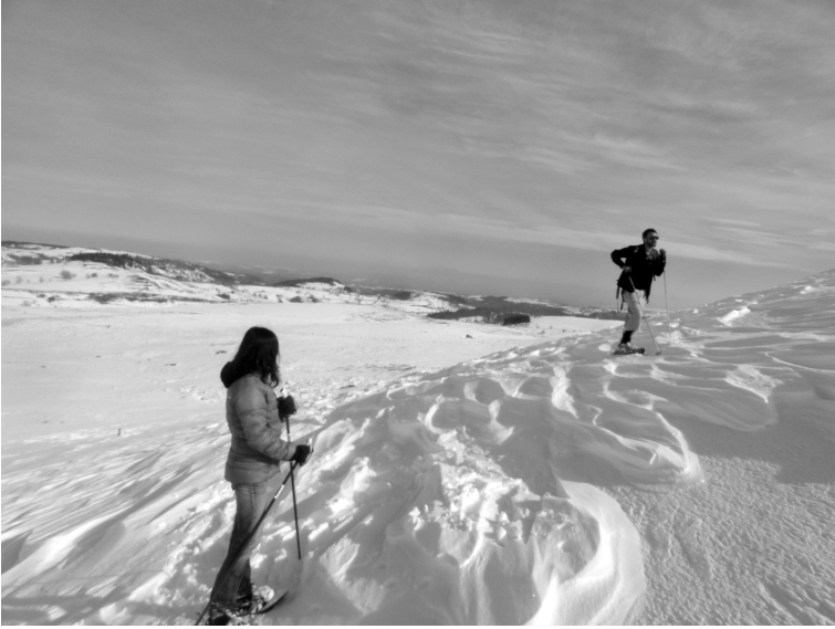
Non loin du lac Glory

ture ou à ski, avant d'espérer gagner le paradis blanc 98 . Les touristes, accueillis et considérés comme des clients, et qui se comportent souvent comme tels, fournissent la manne qui alimente cette économie précieuse dans un pays qui, comme le disent les spécialistes du territoire en pensant au dynamisme des métropoles, crée peu de richesse – tout dépend évidemment ce que vous entendez par « richesse ». La montagne et l'environnement naturel en général sont remodelés en fonction des « attentes de la clientèle », et deviennent sous ce registre de vastes terrains dédiés au sport et aux loisirs des vacanciers en mal de neige et de grand air.