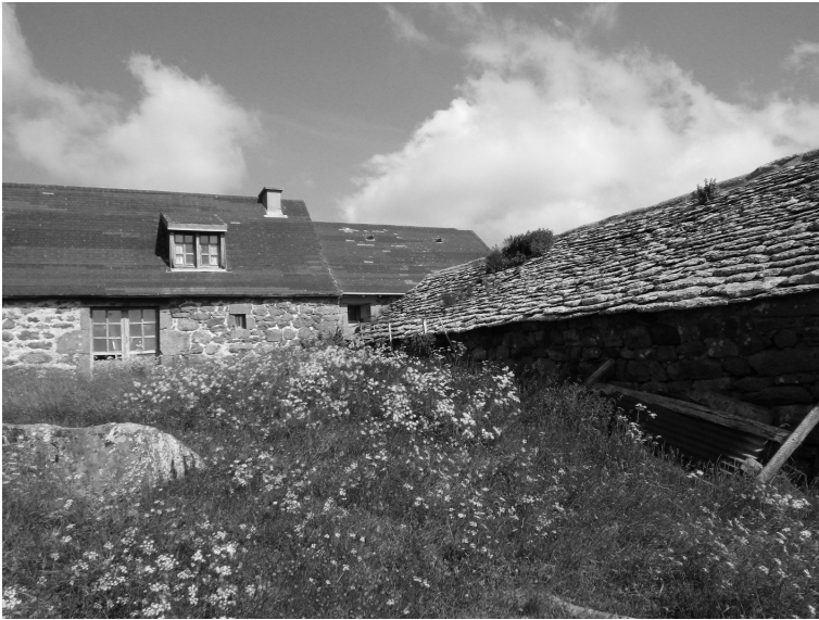
L'ancien foyer de ski de fond à Prat-de-Bouc

avec l'expérience qu'on peut vivre aujourd'hui sur les pistes damées. La pratique se rapproche plutôt de ce qu'on appelle de nos jours le ski de « randonnée nordique » 95 . Le succès de