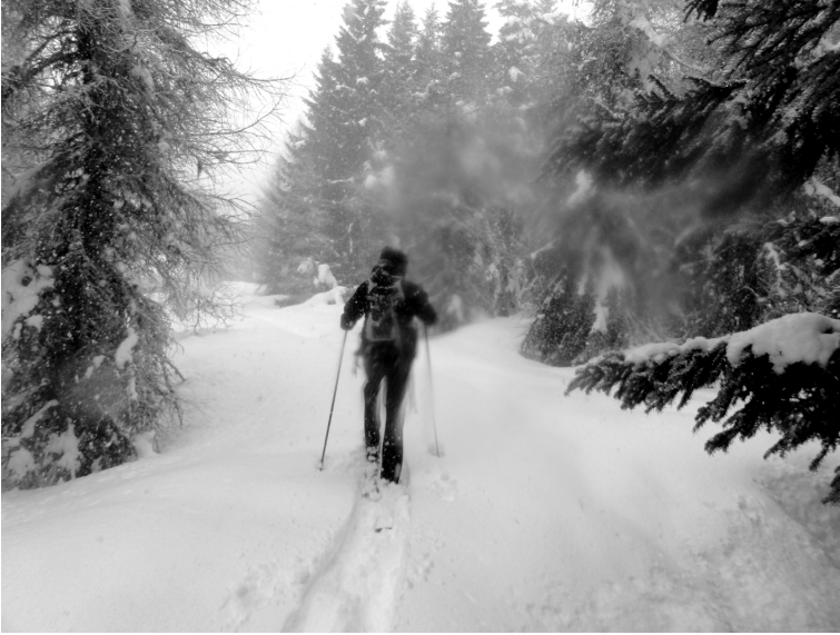
Au bois des Fraux

le foyer, en fin de journée, ce que je craignais est avéré : les routes qui mènent au village sont désormais quasiment impraticables, l'une d'elle, qui passe par Lescure, sera même fermée à la circulation durant tout le mois de février, quant à l'autre, elle est recouverte d'une épaisse couche de neige, de hauteur inégale, jusqu'à trente centimètres par endroit. Comme les quelques skieurs qui sont montés jusqu'ici dans la journée, je dois pour rentrer chez moi adopter un style de conduite « à la limite » : passer en force, en seconde, le pied sur l'accélérateur, afin d'écraser la neige. Les jours suivants, ce sera bien pire. Des congères se forment sous l'effet de la tourmente, ce qui fait qu'on circule à la sortie du village entre des murs de neige de deux mètres de hauteur, lesquels parfois s'effondrent sur la chaussée, et le manque de visibilité complique encore les choses. La neige s'écrase sur le pare-brise, on avance comme on peut, à l'aveugle, dans un maelström de blancheur. Si une automobile a entrepris de monter dans l'autre sens, c'est le face à face assuré. Par moments, en terrain dégagé, plus rien ne distingue la chaussée des prairies qui la bordent : le facteur m'a raconté qu'il lui arrivait de passer carrément par le pré, la neige étant moins